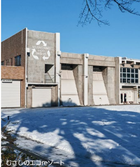
むさしのエコリゾート