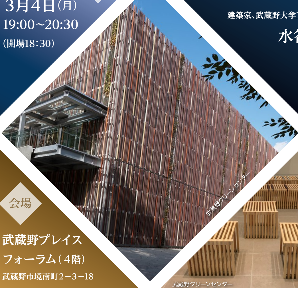
武蔵野クリーンセンター

TEL : 0422-60-1873 Email : SEC-MACHIDUKURI@city.musashino.lg.jp