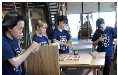
福岡県大川市 モノ作りの魅力発信プロジェクト

武蔵野大学1年生が参加する学科横断型のプログラム。国内外70以上のプログラムから選択し、大学を飛び出して実践的に学びます。企業・自治体・団体と連携した産学・官学連携のプログラムや、国内外の修学関連施設を訪れるなど武蔵野大学独自の多彩なプログラムを用意しています。実践的な学びで、学科の専門の学びと社会のつながりをより明確に理解し、実社会における課題解決力を養います。