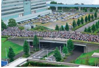
コミックマーケット86の会場へ入場していく人の行列

参考文献に記載されている具体的な数値を代入することで、行列内での並び方は前の人と0.62m空けて並べばよいことがわかった。