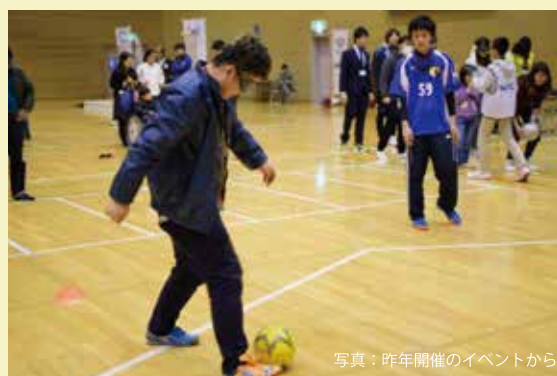
写真: 昨年開催のイベントから