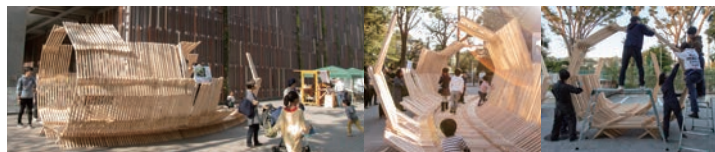
武蔵野クリーンセンター OPEN HARVEST 出展 2019年11月2日 (東京都武蔵野市)