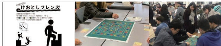
ゲームマーケット2019秋 出展 2019年11月24日 東京ビッグサイト (東京都江東区)