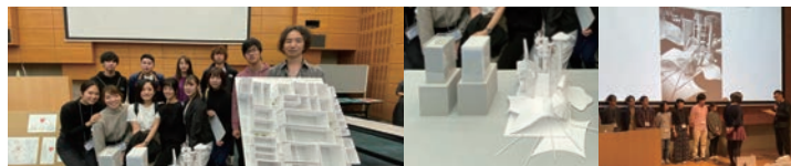
建築文化週間 学生ワークショップ2019「令和元年の建築研究室」最優秀賞・優秀賞・奨励賞・学生賞・佳作 受賞 2019年11月26-27日 建築会館ホール (東京都港区)