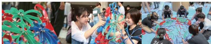
日本建築学会主催 学生サマーセミナー2019 出展 2019年7月13日 建築会館イベント広場 (東京都港区)