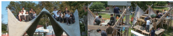
構造 de アート HP シェル曲面構造物制作 武蔵野大学 実習棟 横 (東京都西東京市)