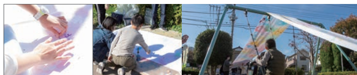
西東京市「ひばり日和」 2019年11月17日 住吉第4公園 (東京都西東京市)