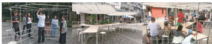
深川敬老感謝祭 2019年9月15, 16日 (東京都江東区)