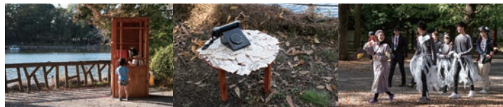
トロールの森2019 入選・出展・アートパフォーマンス 2018年11月3-11月23日 都立善福寺公園・東京都杉並区西荻窪周辺