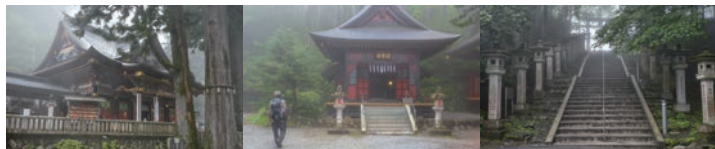
建築 de MAP フィールド調査 2019年4月 - , 2019年9月3-4日 下谷谷 - 秩父三峯神社代参行