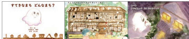
第15回「家やまちの絵本」コンクール 合作の部 入選 2019年10月12日