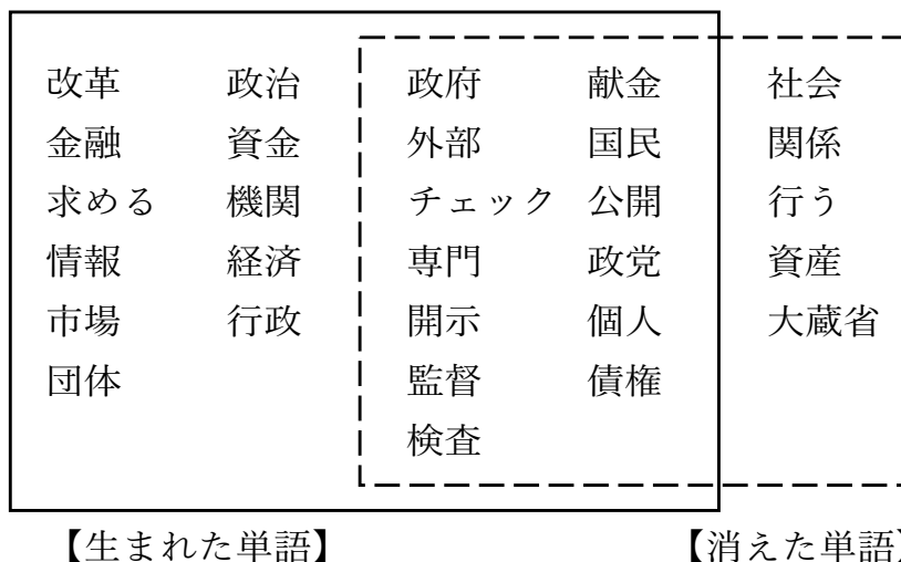
図4 1990年代の特徴単語

図4は1990年代の特徴単語を示している。1990年代は1980年代と2000年代と挟まれていることから、「消えた単語」と「生まれた単語」の両方がある。それゆえ、両者に共通する、すなわち時代を代表する単語も見られる。