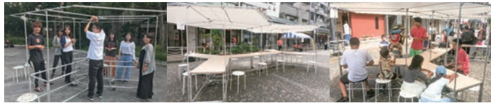
深川敬老感謝祭 2019年9月15, 16日 (東京都江東区)