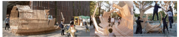
武蔵野クリーンセンター OPEN HARVEST 出展 2019年11月2日 (東京都武蔵野市)