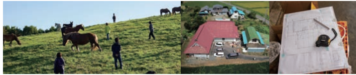
遠野オフキャンパス 2019年9月9-12日, 11月29-30日 (岩手県遠野市)