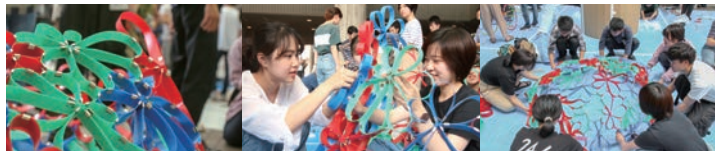
日本建築学会主催 学生サマーセミナー2019 出展 2019年7月13日 建築会館イベント広場 (東京都港区)