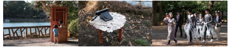
トロールの森2019 入選・出展・アートパフォーマンス 2018年11月3-11月23日 都立善福寺公園・東京都杉並区西荻窪周辺