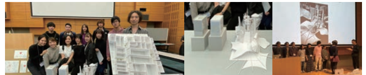
建築文化週間 学生ワークショップ2019「令和元年の建築研究室」最優秀賞・優秀賞・奨励賞・学生賞・佳作 受賞 2019年11月26-27日 建築会館ホール (東京都港区)