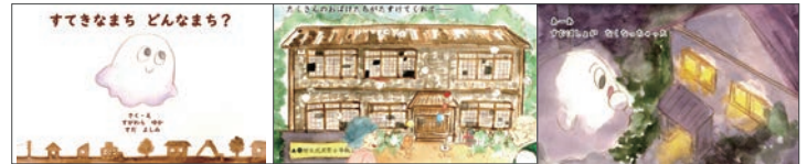
第15回「家やまちの絵本」コンクール 合作の部 入選 2019年10月12日