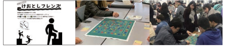
ゲームマーケット2019秋 出展 2019年11月24日 東京ビッグサイト (東京都江東区)