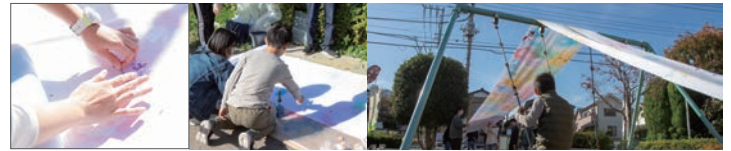
西東京市「ひばり日和」 2019年11月17日 住吉第4公園 (東京都西東京市)