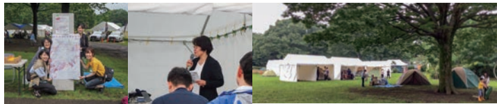
復興まちづくりキャンプ 2019 2019年7月13-15日 都立小金井公園 (東京都小金井市)