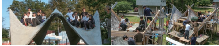
構造 de アート HP シェル曲面構造物 制作 武蔵野大学 実習棟 横 (東京都西東京市)