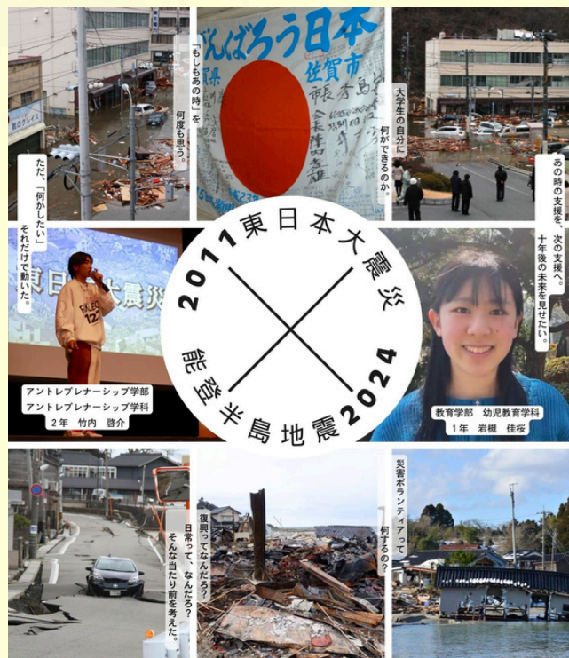
武蔵野大学ボランティアセンター2024企画

災害ボランティア 第一弾 学生講演×対談 「—2011.3.11から2024.1.1能登へ—」