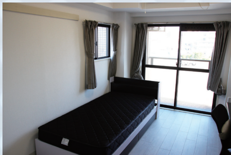
居室内イメージ Room interior