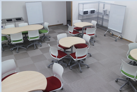
国際交流ラウンジ International Communication Lounge