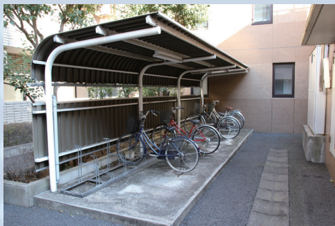
駐輪場 Bicycle Parking